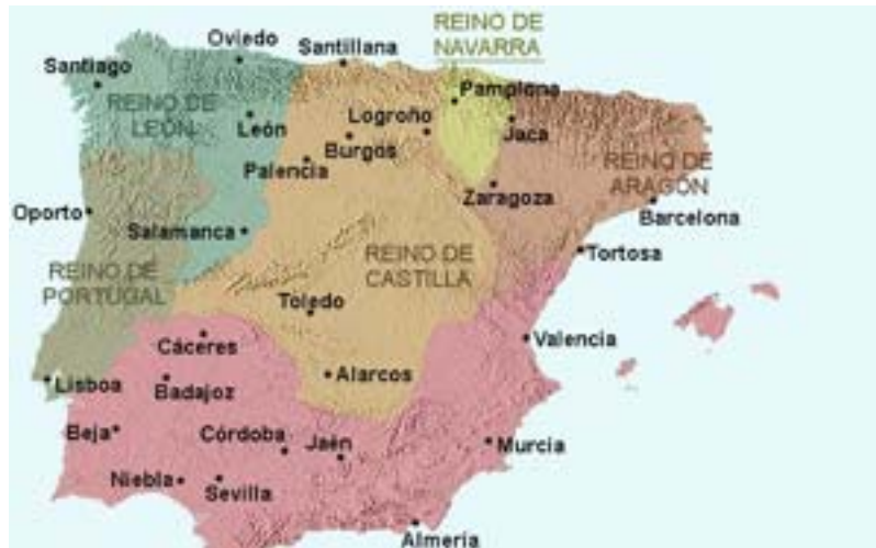
Los reinos cristianos

A partir de sus conocimientos y del material adjunto desarrolle el tema La Península Ibérica en la Edad Media: los reinos cristianos (Valoración máxima: 6 puntos) y responda a los siguientes términos históricos y preguntas: