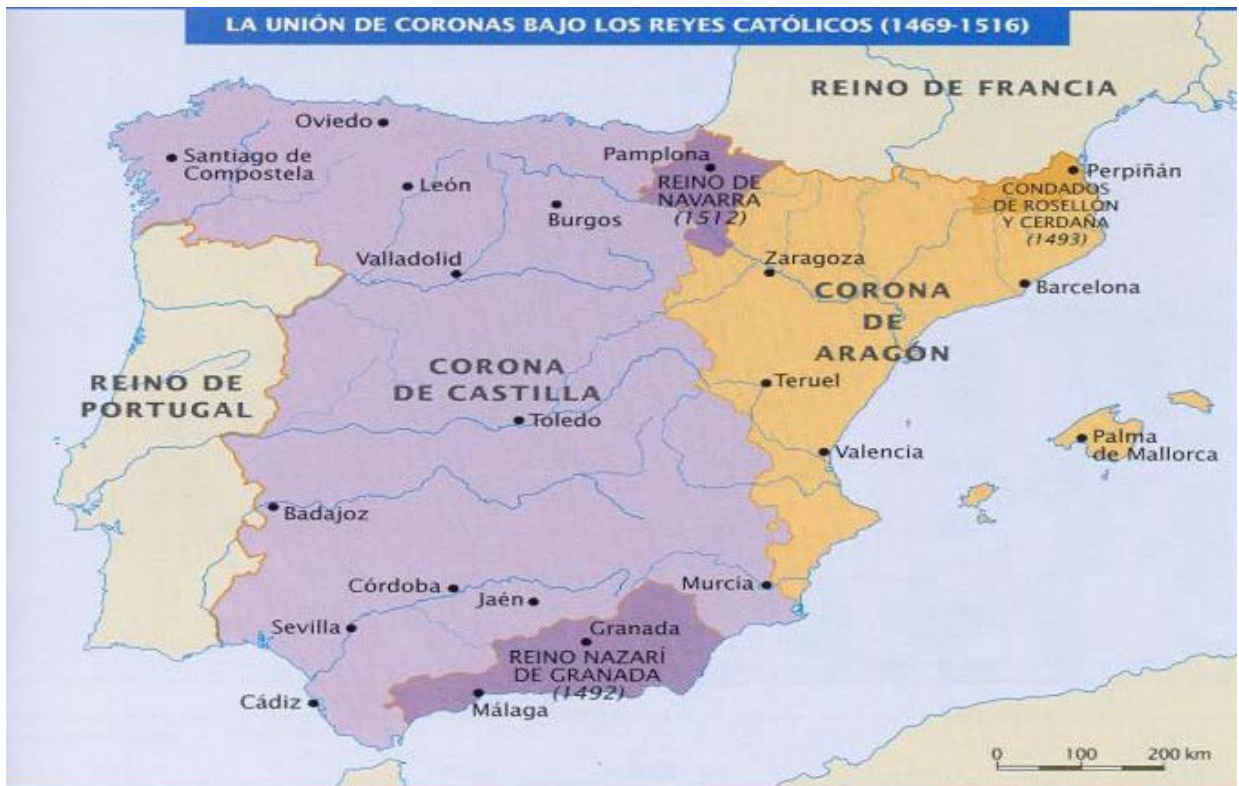
La España de los Reyes Católicos

A partir de sus conocimientos y del material adjunto desarrolle el tema Los Reyes Católicos: la construcción del Estado moderno (valoración máxima: 6 puntos) y responda a los siguientes términos históricos y preguntas: