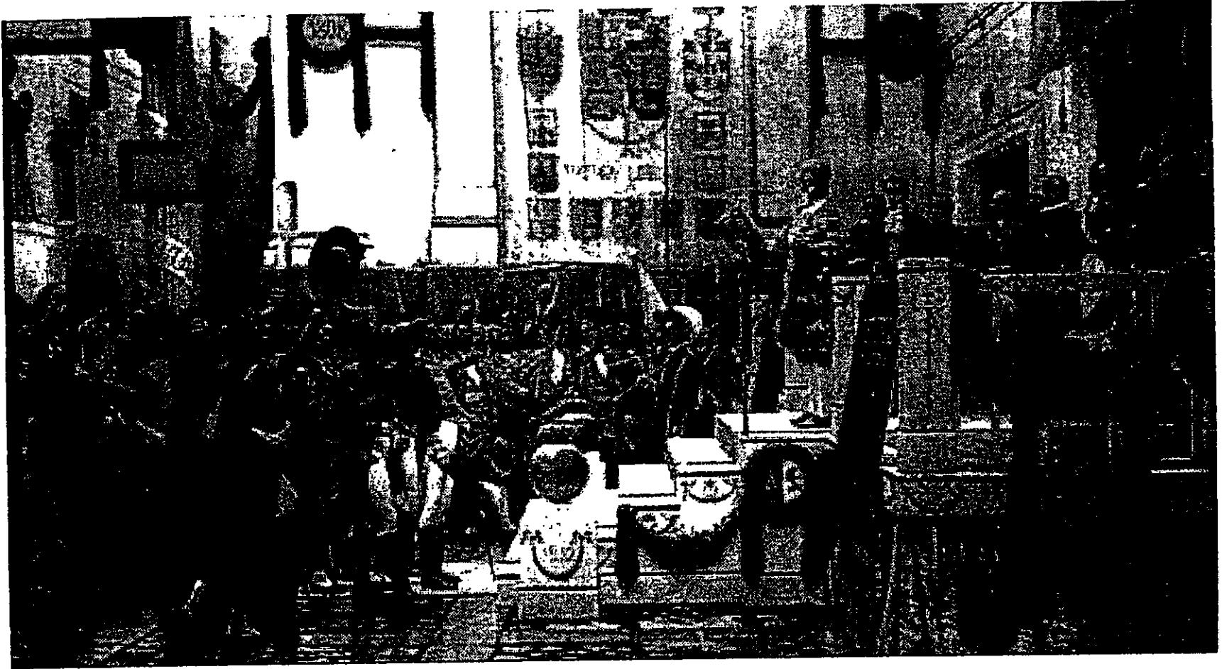
Proclamación de la Constitución de Cádiz, por Salvador Viniegra

* A partir de sus conocimientos y de los materiales adjuntos, desarrolle el tema :