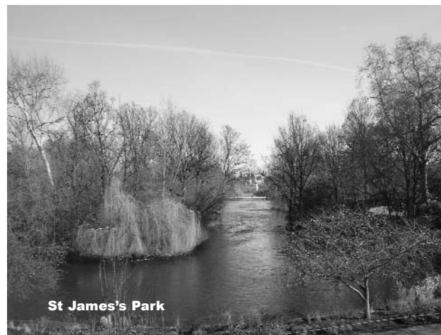
St James's Park

St James's Park is the oldest and the smallest of these three parks. It is very near Buckingham Palace and it has very beautiful gardens.